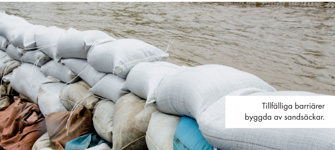
Tillfälliga barriärer byggda av sandsäckar.

Villkoren för hemförsäkringar kan variera. Ta reda på vad som gäller för just dig om du skulle drabbas av en översvämning. Dokumentera skador och spara kvitton så att du inte får stå för en onödigt stor del av kostnaderna för översvämningen själv.