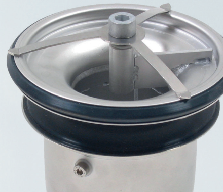
Esimerkki pumpusta ja tulpasta lattiakaivolle.