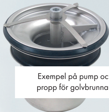
Exempel på pump och propp för golvbrunnar.